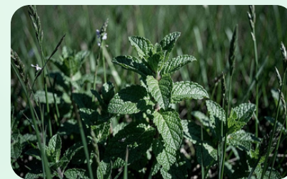
Menthe des Champs

Intense et riche en menthol, parfaite pour les infusions digestives. Son arôme puissant rafraîchit et tonifie en une seule tasse.